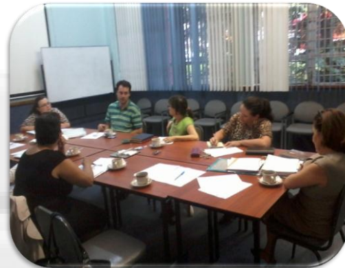
Imagen no. 3 Reunión en la Facultad de Educación de los coordinadores de las Comisiones de Autoevaluación, Agosto 2012

La Facultad de Educación convocó a los y las representantes de las Comisiones de Autoevaluación para realizar un recuento de acciones y para estandarizar información vinculada con estándares requeridos para los procesos de autoevaluación.