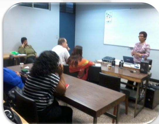
Imagen no. 4 Taller del DEDUN con los profesores y profesoras de las carreras de EBCI, Octubre 2012.

Entre los procesos de mejora que se están llevando a cabo se encuentra el fortalecimiento del proceso educativo. La actualización de docentes se ha establecido como una prioridad. En el mes de octubre inició el Taller impartido por el DEDUN con los profesores y profesoras de las carreras de la EBCI para fortalecer sus conocimientos en docencia, con una nutrida asistencia.