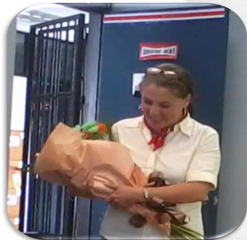
Imagen no. 2 Profesora Magda Cecilia Sandí Sandí Premio Nacional de Bibliotecología 2012

En el mes de octubre se recibió con beneplácito la noticia de que la Prof. Magda Sandí Sandí, fue galardonada con el Premio Nacional de Bibliotecología que otorga el Colegio de Bibliotecarios de Costa Rica.