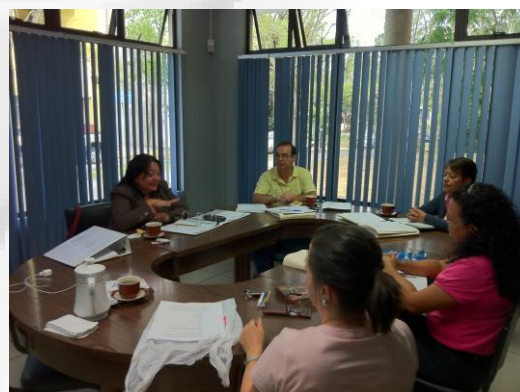
Imagen no. 3 Taller con los responsables de las secciones EBCI para evaluar los programas de los cursos que se imparten.