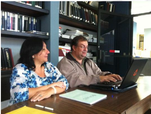
Imagen no. 5 Integración de los representantes de la Asociación de Estudiantes de Bibliotecología en la Comisión de Autoevaluación.