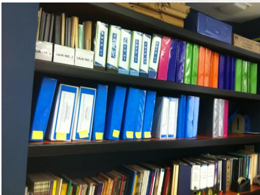
Imagen no. 6 El proceso de autoevaluación incluye cuatro dimensiones: admisibilidad, recursos, proceso educativo y resultados. Las evidencias son respaldadas en diversos formatos para la redacción del informe final.