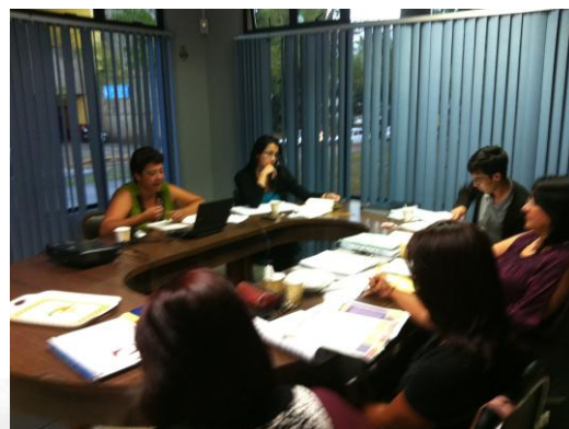
Imagen no. 2 Integración de la Comisión de Autoevaluación de las carreras que imparte la EBCI.

A continuación se presentan imágenes de diversas etapas del proceso que evidencian el avance.