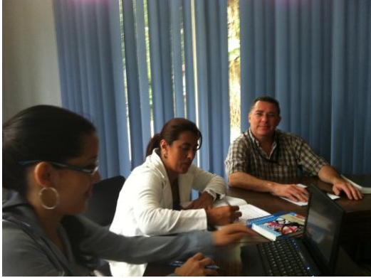
Imagen no. 4 Revisión de instrumentos para la recopilación de información empírica.