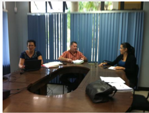
Imagen no. 4 Integración de funcionarios clave del Centro de Evaluación Académica de la Universidad de Costa Rica.