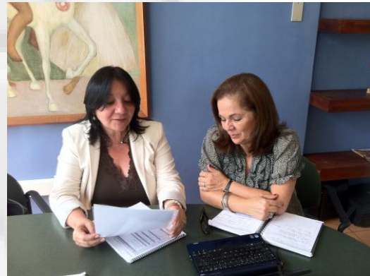
Imagen no. 8 La recolección de información específica para completar la investigación relacionada con el proceso educativo ha incorporado la consulta entre otros a la señora Decana de la Facultad de Educación.