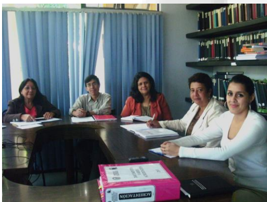
Imagen no. 1 Reuniones preliminares del proceso de autoevaluación.