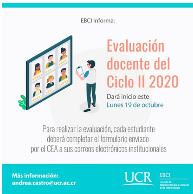
Figura 1. Divulgación del proceso de evaluación al personal docente para el II ciclo 2020.