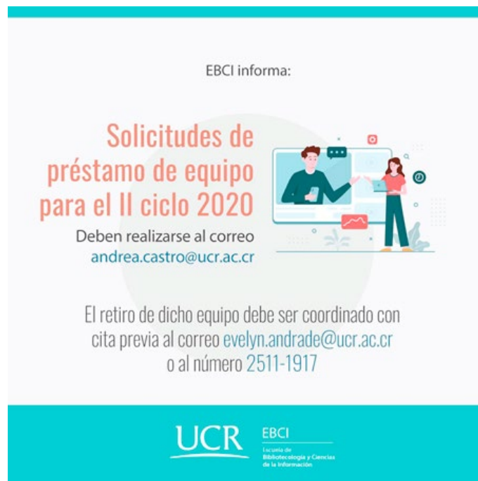
Figura 2. Procedimiento para solicitud de préstamo de equipo al estudiantado de las carreras